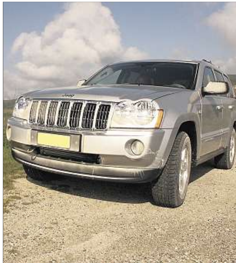
Déi Gréng veut des plafonds d'émission de CO 2 pour les voitures individuelles. Le parti vise tout particulièrement les 4x4 et les berlines.